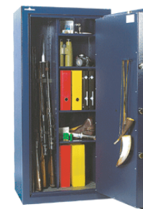
Exemple d'aménagement n°3 pour 4 armes.