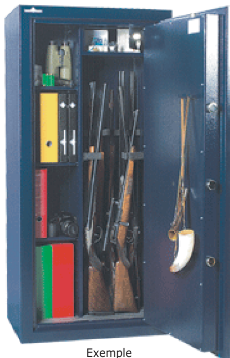
Exemple d'aménagement n°1 pour 10 armes.

Porte renforcée à triple paroi d'une épaisseur totale de 115 mm.