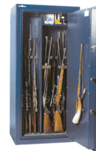
Exemple d'aménagement n°2 pour 14 armes.

Blindage anti-perçage au manganèse du système de condamnation.