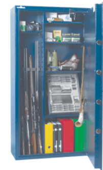
Exemple d'aménagement n°3 pour 5 armes.