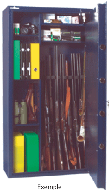
Exemple d'aménagement n°1 pour 9 armes.

Porte à paroi d'une épaisseur totale de 65mm avec plaque de blindage de 6mm.