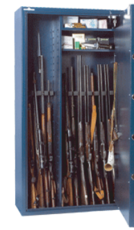
Exemple d'aménagement n°2 pour 14 armes.

Blindage anti-perçage au manganèse du système de condamnation.